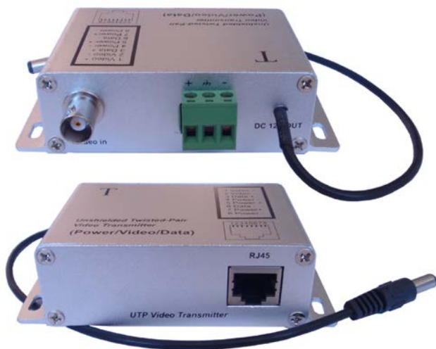
Рис.1 Внешний вид передатчик TA-CPD