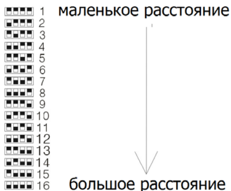
Рис.3 Комбинации DIP-переключателей на приёмнике RA-CPD