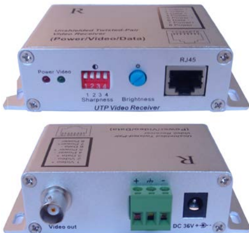
Рис.2 Внешний вид приемника RA-CPD