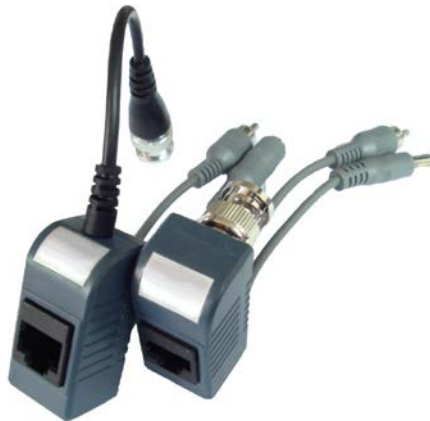
Рис.1 Внешний вид TP-CPA